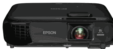
PROJECTOR / BEAMER

projecteert het ontvangen beeldsignaal vanuit uw computer of mediabox op uw muur of projectiescherm.