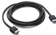
HDMI KABEL (TYPE MALE A / MALE A)

hiermee navigeert u naar HBC TV en speelt u de stream af