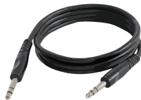
STEREO JACK (3,5mm MALE) KABEL

luister daarom de audio bijv. via een goede koptelefoon of uw versterker en luidsprekers.