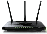
MODEM / ROUTER

Sommige moderne projectors hebben de functie aan boord om via uw tablet of smartphone gestreamd beeld en geluid te ontvangen, in dit geval heeft u geen Apple TV nodig.