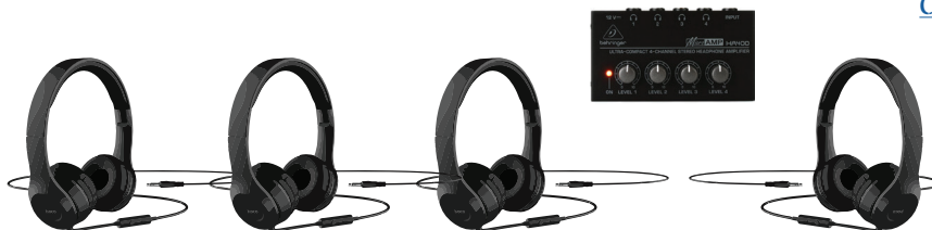
HEADPHONE SPLITTER / VERSTERKER

split uw headphone signaal in 4 aparte stereo headphone signalen met aparte volume regeling. uiteraard ook gewoon geschikt voor gebruik met 2 hoofdtelefoons.