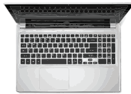
LAPTOP / DESKTOP COMPUTER

verbindt uw smartphone, tablet, telefoon of computer via WIFI met uw internetverbinding